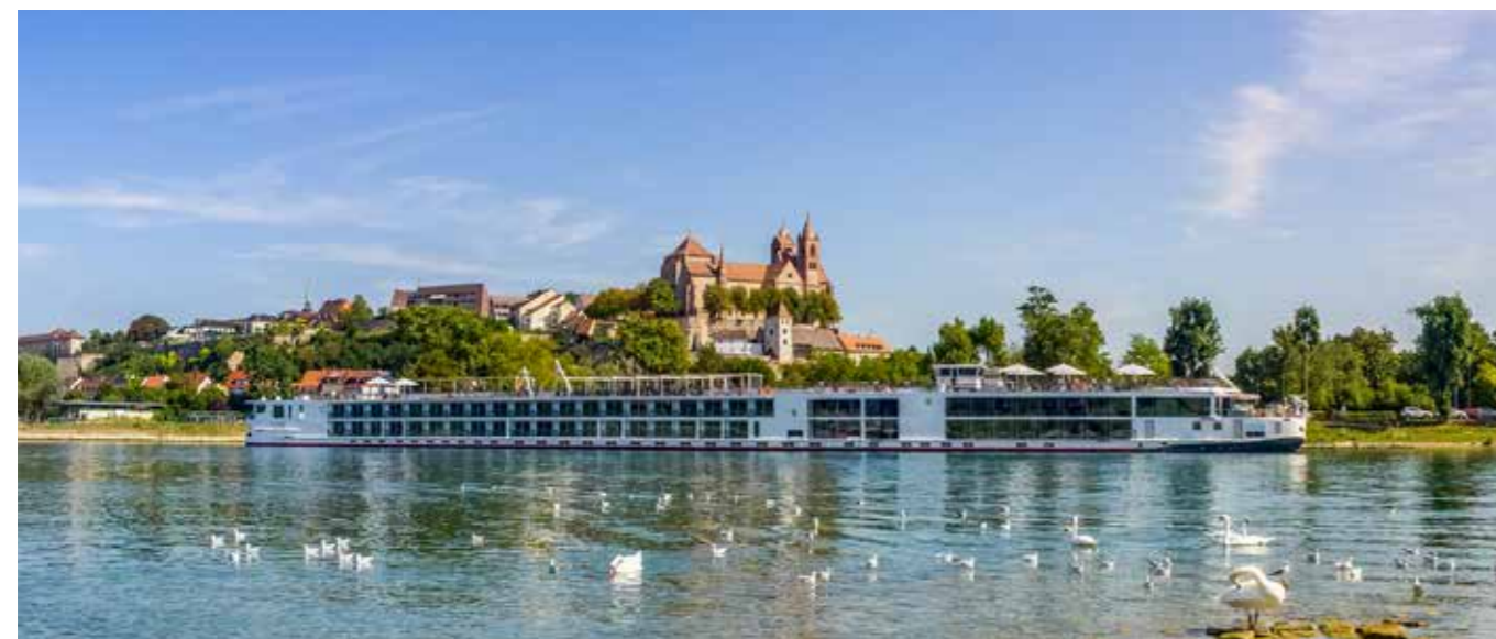
Breisach ist schön am Rhein gelegen und immer einen Besuch wert. Ende August findet hier das große Bereichsweinfest Kaiserstuhl und Tuniberg statt.

An manchen Tagen finden keine Kellerführungen statt. Dann wird Ersatz angeboten, zum Beispiel in Form einer Weinbergfahrt. Bitte informieren Sie sich vorab bei den Veranstaltern.