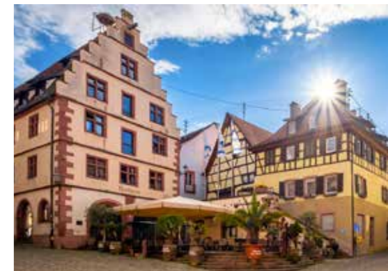
Das Königschaffhauser Tor (r. o.) – im Volksmund „Torli“ genannt – ist eines der Wahrzeichen von Endingen (großes Bild l.). Auf dem Marktplatz (r. u.) trifft man sich im Sommer zum Eissschlotzen, bei Veranstaltungen und Märkten. Die St. Katharinenkapelle (o. l.) ist ein beliebtes Ausflugsziel.