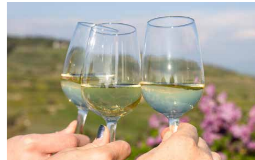
Winzerfeste, Weinproben, Hocks – einen Grund, gemeinsam zu feiern, findet sich hier immer.

Festspiele Breisach Ort: Breisach, Festspielgelände (Münsterberg, Schloßplatz) Uhrzeit: 20.00 Uhr festspiele-breisach.de