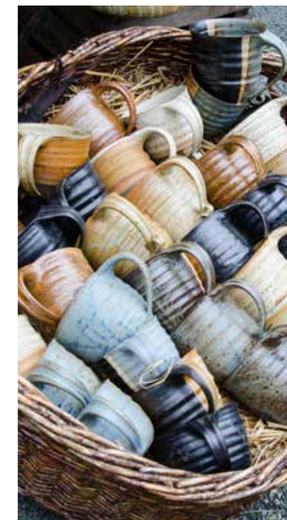
Gefäße aus Keramik, Kunstwerke und Körbe bietet der Breisacher Töpfermarkt im Juni.

Festspiele Breisach Ort: Breisach, Festspielgelände (Münsterberg, Schloßplatz) Uhrzeit: 20.00 Uhr festspiele-breisach.de