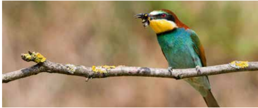
Bienenfresser mit buntem Gefieder: Am 9. Juli widmet sich eine Führung dem auffallenden Vogel.